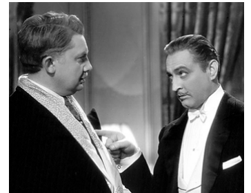
1933 LES INVITÉS DE HUIT HEURES (Dinner at eight) de George Cukor avec John Barrymore