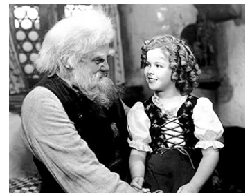
1937 HEIDI LA SAUVAGEONNE (Heidi) d'Allan Dwan avec Shirley Temple