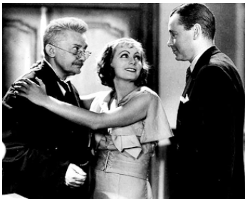
1934 LE VOILE DES ILLUSIONS (The painted Veil) de R. Boleslawski avec G. Garbo, H. Marshall