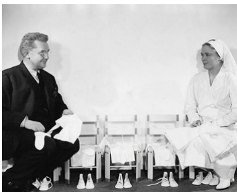
1936 LE MÉDECIN DE CAMPAGNE (The Country Doctor) d'Henry King avec Dorothy Patterson