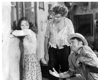
1929 SOUS LE CIEL DES TROPIQUES (Hell Harbor) d'Henry King avec Lupe Velez, Gibson Gowland