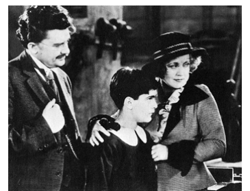
1931 SA FAUTE (The Sin of Madelon Claudet) d'Edward Selwyn avec Helen Hayes