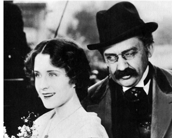
1927 VIEIL HEIDELBERG (The Student Prince) d'Ernst Lubitch avec Norma Shearer