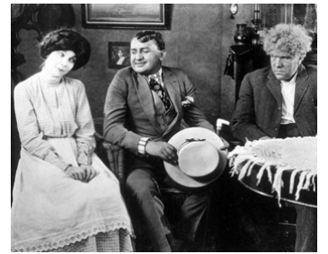
1924 LES RAPACES (Greed) d'Erich von Stroheim avec ZaSu Pitts, Gibson Gowland