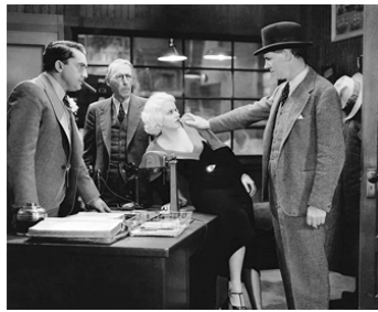
1931 LA BÊTE DE LA CITÉ (Beast of the City) de Ch. Brabin avec T. Marshall, J. Harlow, W. Huston