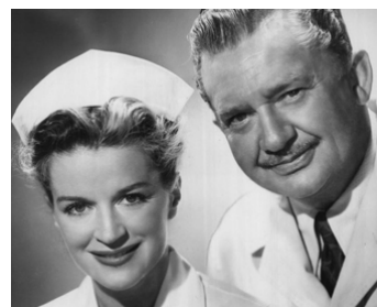
1939 MEET DOCTOR CHRISTIAN de Bernard Vorhaus avec Rosemary DeCamp