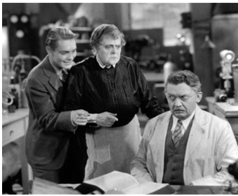
1931 MES PETITS (Emma) de Clarence Brown avec Richard Cromwell, Mary Dressler