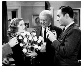
1935 CŒURS BRISÉS (Break at Hearts) de Phillip Moeller avec Katharine Hepburn, Charles Boyer