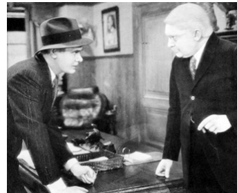
1932 LE BARON DE LA BIÈRE (Song of the Eagle) de Ralph Murphy avec Charles Bickford