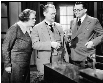
1933 PRENEZ GARDE À LA PEINTURE (Christopher Bean) de Sam Wood avec M. Dressler, L. Barrymore