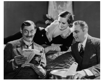
1932 GRAND HÔTEL (Grand Hotel) d'Edmund Goulding avec Joan Crawford, John Barrymore