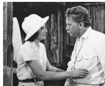
1936 LA FIÈVRE DES TROPIQUES (His Brother's Wife) de W. S. Van Dyke avec Barbara Stanwyck