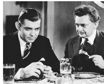
1934 LES HOMMES EN BLANC (Men in White) de Richard Boleslawski avec Clark Gable