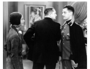
1931 L'AUBE (Daybreak) de Jacques Feyder avec Helen Chandler, Ramon Novarro