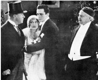
1928 MON CURÉ CHEZ MON RABBIN (Abie's Irish Rose) de V. Fleming avec N. Carroll, Ch. Rogers