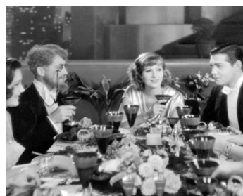
1931 LA COURTISANE (Susan Lenox) de Robert Z. Leonard avec Greta Garbo, Clark Gable