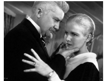
1934 FONTAINE (The Fountain) de John Cromwell avec Ann Harding