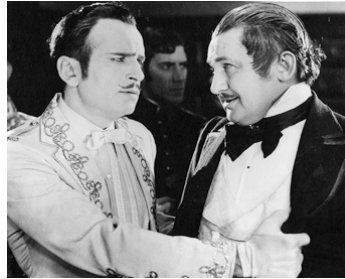
1925 DON X, FILS DE ZORRO (Don Q Son of Zorro) de Donald Crisp avec Douglas Fairbanks Sr