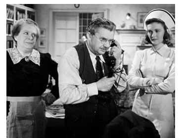
1940 DR CHRISTIAN MEET THE WOMEN de William McGann avec Maude Eburne, Dorothy Lovett