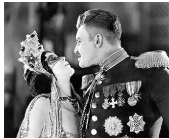
1922 LA FOLIE DU JAZZ (Jazzmania) de Robert Z. Leonard avec Mae Murray