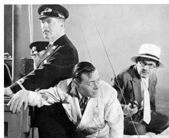
1939 MONSIEUR MOTO EN PÉRIL (Mr Moto in danger island) d'H. Leeds avec Peter Lorre