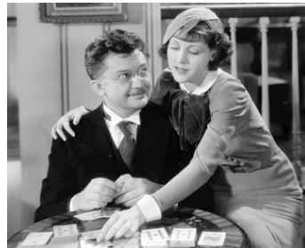
1932 LE CRIME DU SIÈCLE (The Crime of the Century) de W. Beaudine avec Frances Dee