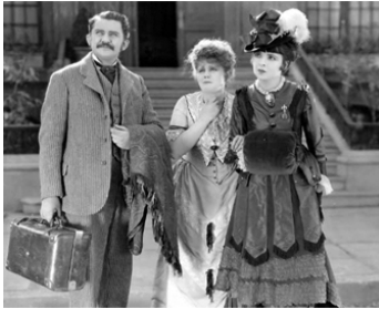
1924 MON GRAND (So big) de Charles Brabin avec Dot Farley, Colleen Moore