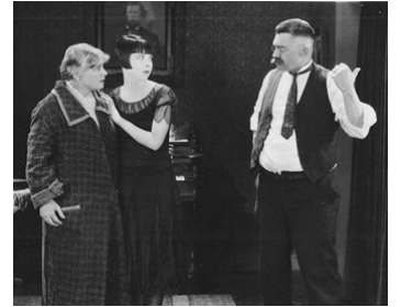
1926 ÇA C'EST DE L'AMOUR d'Alfred E. Green avec Bodil Rosing, Colleen Moore