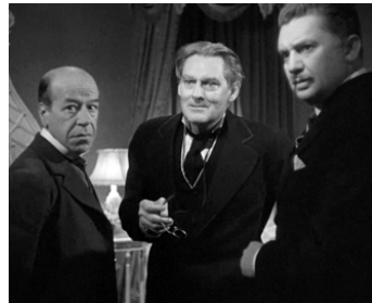
1935 LA MARQUE DU VAMPIRE (Mark of the Vampire) de Tod Browning avec D. Meek, L. Barrymore