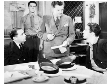
1935 MEURTRE DANS LA MARINE (Murder in the Fleet) d'E. Sedgwick avec D. Cook, R. Taylor