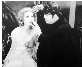
1933 LE CHAT ET LE VIOLON (The Cat and the Fiddle) de William K. Howard avec Helen Twelvetrees