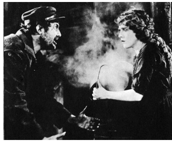
1922 TESS AU PAYS DES TEMPÊTES (Tess of the Storm Country) de John S. Robertson avec Mary Pickford