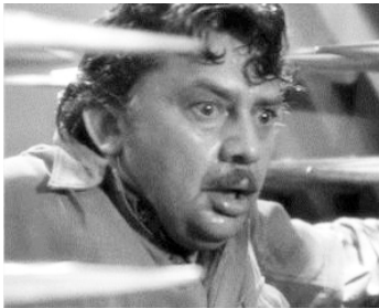
1932 LE MASQUE D'OR (The Mask of Fu Manchu) de Charles Brabin