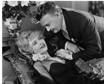
1928 L'ÉTERNEL PROBLÈME (The Battle of the Sexes) de David W. Griffith avec Phyllis Haver