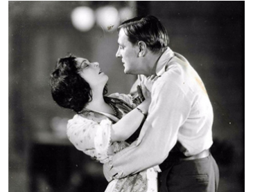
1927 L'HEURE SECRÈTE (Beggars of Love) de Rowland V. Lee avec Pola Negri