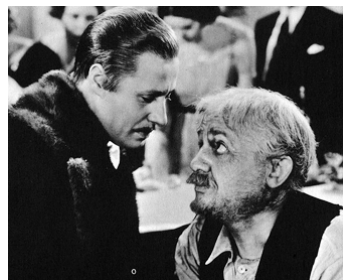
1936 LE CHANT DES CLOCHES (Sins of Man) de Gregory Ratoff avec Don Ameche