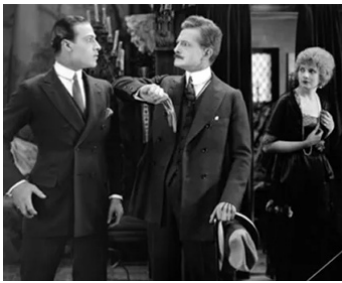
1921 LES 4 CAVALIERS DE L'APOCALYPSE de Rex Ingram avec R. Valentino, Alice Terry